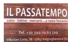
VILLA SAN CARLO