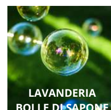
VILLA SAN CARLO