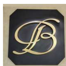
GIOIELLERIA BASSANI OLGINATE