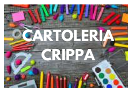
VILLA SAN CARLO